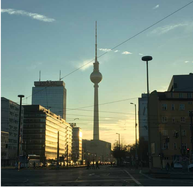
Alexanderplatz | Berlin