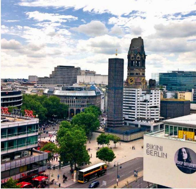
Rooftop Bikini, Berlin