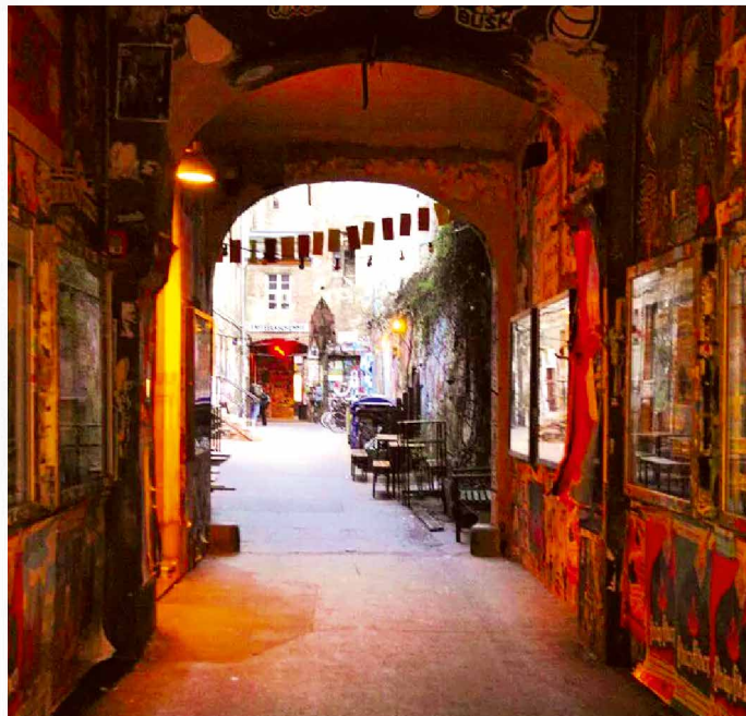
Hackesche Höfe, Berlin